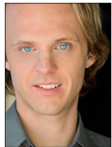
David Wilcock (*1973), US-am. Psychologe, Autor, alternativer Forscher und Filmemacher in Los Angeles, Californien. Sein Buch über Urfeld-Forschungen machte Wilcock zum Autor des Jahres 2011

eine ovale, geschlossene organische Schüssel aussah, die Mannschaft sah aus, wie Oktopusse, also Kraken.“